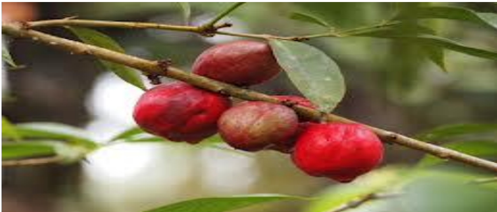
جمبو ماوار برورنا مير ه