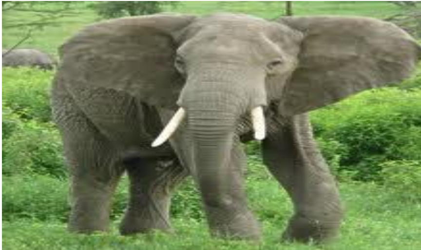
گاجه ادا دوا گادیغ Gajah ada dua gading