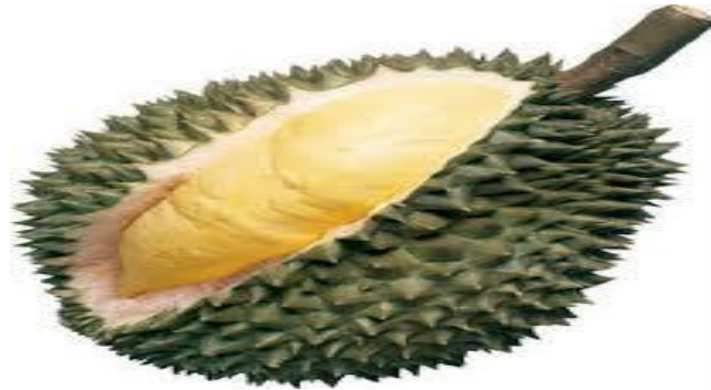
دورين کوليتن بردوري Durian kulitnya berduri