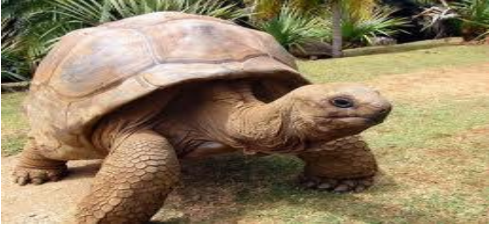
كورا-كورا كوليتن كراس Kura - Kura kulitnya keras