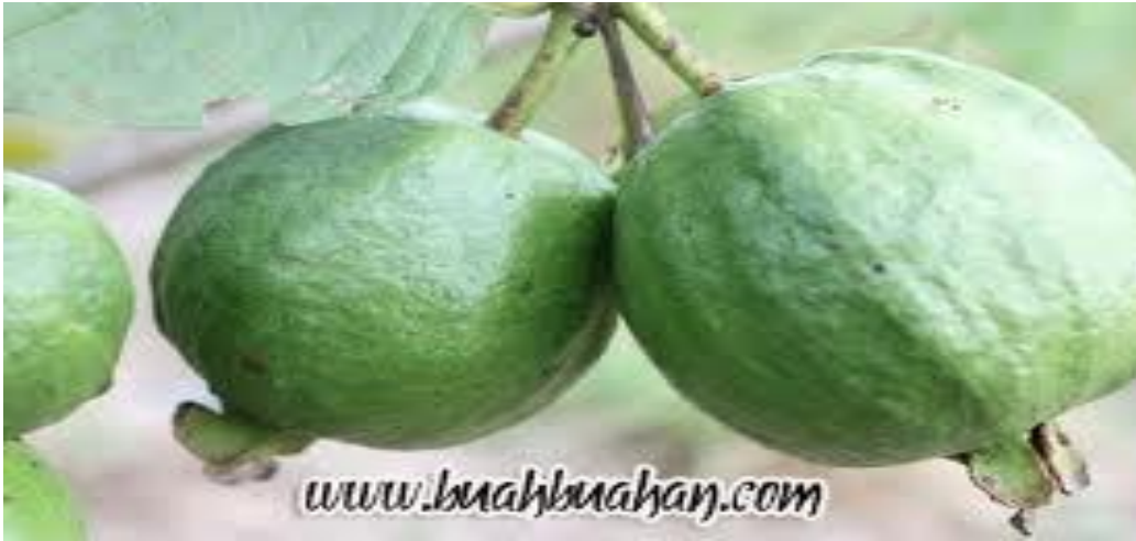
جمبو باتو برورنا هيچاو Jambu batu berwarna hijau