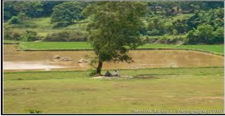
فوكو ايت بسر Pokok itu besar