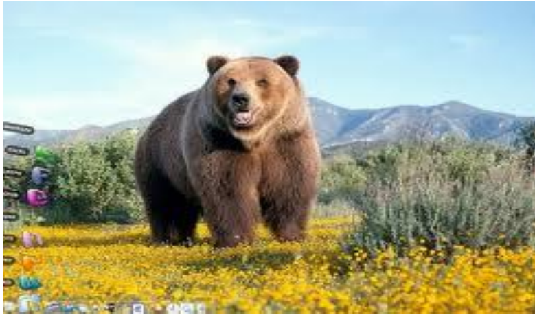
برواغ هيدوف دهوتن Beruang hidup di hutan