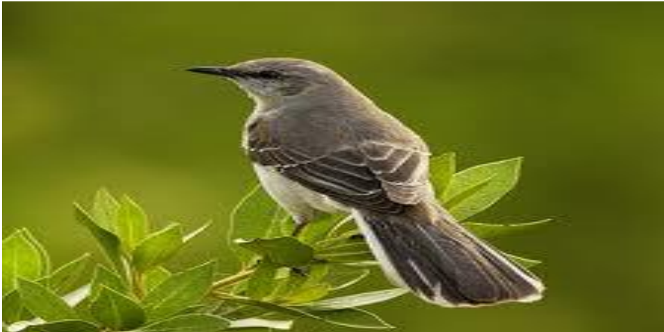
بوروغ تربغ تيغكي داودارا Burung terbang tinggi di udara