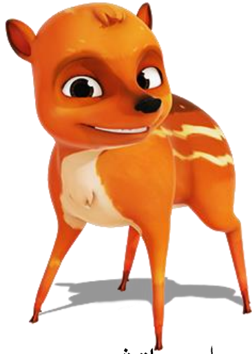
کنچیل بناتغ چردیق Kancil binatang cerdas